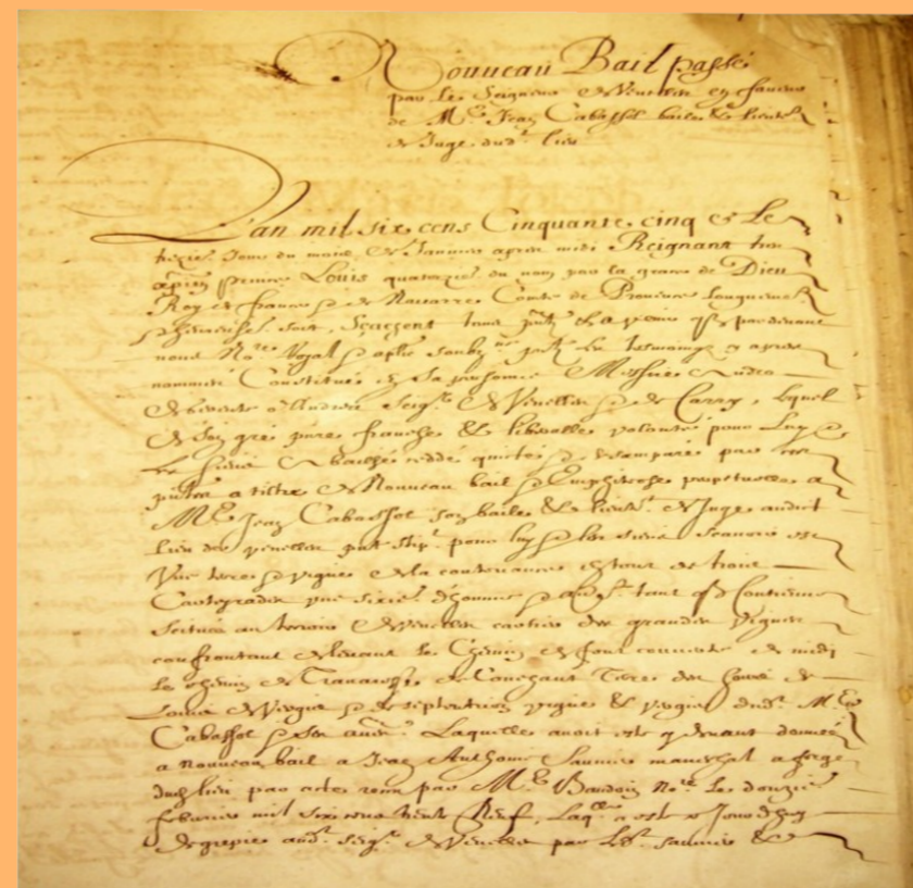
Acte de Reconnaissance de 1655 (AD13 31E 188 7029)