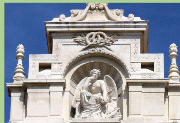
Palais des Arts à Marseille