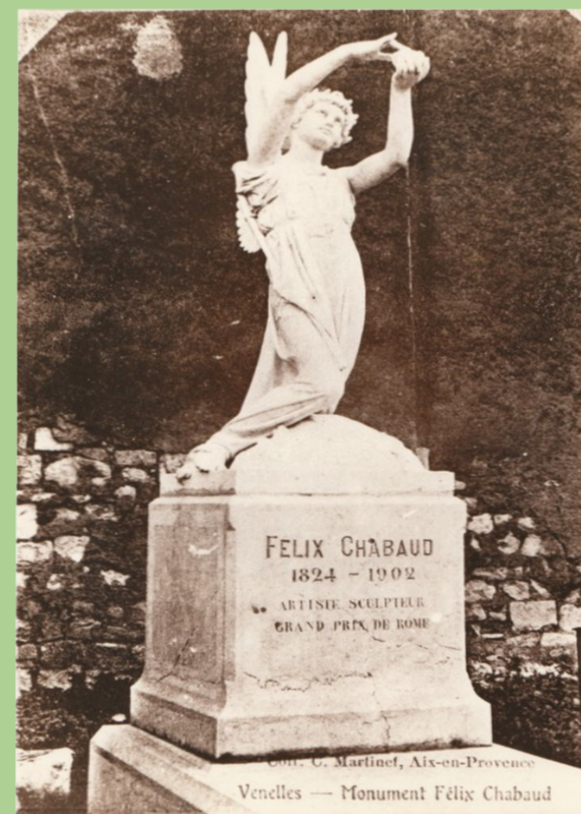
L'ange qui se trouve sur la tombe du sculpteur.